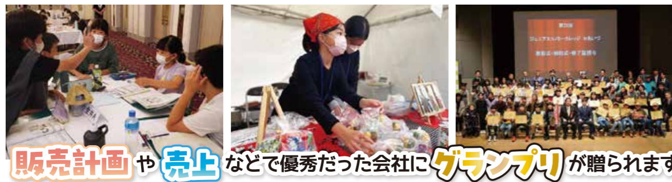
販売計画や売上などで優秀だった会社に グランプリ が贈られます

「自ら決めて行動できる人材育成プログラム」 それがジュニアエコノミーカレッジです。